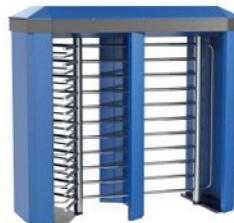
REXON DEA 3 GATE-FULL