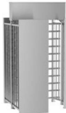
REXON ERA 4-LE