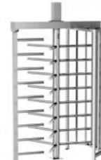
REXON BASIC 3