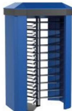
REXON DEA 3