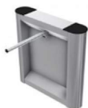
Bar One Unipod

Bramki obrotowe są klasycznym i skutecznym sposobem na zabezpieczenie stref chronionych zarówno wewnątrz jak i na zewnątrz budynków. Stanowią komfortową i ekonomiczną alternatywę dla innych rozwiązań z zakresu wejścia do obiektów z systemem kontroli dostępu. Dzięki szerokiej gamie produktów i możliwości adaptacji do potrzeb inwestora, bramki typu BAR mogą być łatwo dostosowane do każdego rodzaju wnętrza.