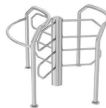
ROUND J-J 5