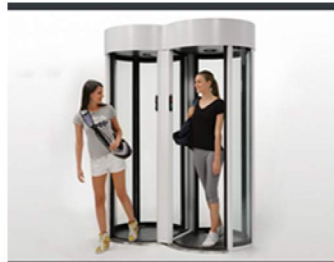
AUTOMATYCZNA RECEPCJA 24H