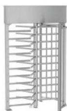
REXON ERA 3