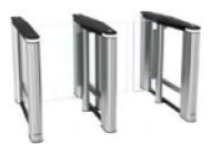
EasyGate ELITE 3D Top

Uchylne bramki szybkiego tranzytu EasyGate są odzwierciedleniem najnowszych trendów w zakresie mechanicznej kontroli dostępu do obiektów. Łączą w sobie najwyższe walory estetyczne i funkcjonalne oraz wysoki poziom zabezpieczenia. Bramki tego typu charakteryzują się eleganckim i nowoczesnym wyglądem oraz kompaktową obudową. Szeroka gama produktów, opcji wykończeniowych i akcesoriów daje możliwości dowolnej konfiguracji oraz dostosowania urządzeń do indywidualnych potrzeb. Dzięki zastosowanej technologii i wysokogatunkowym materiałom stanowią niezawodne i jakościowe rozwiązanie na długie lata.