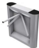
Bar One Tripod