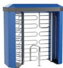
REXON DEA 3 GATE-BIKE