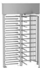
REXON ERA 4