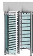
REXON ERA 3 GS