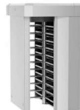
REXON DEA 4