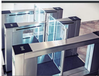
BRAMKI I FURTY