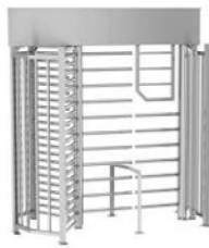
REXON ERA 3 GATE-BIKE