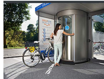
PARKING ROWEROWY BIKE GUARDIAN