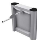
Bar One Gate