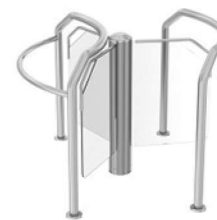
ROUND E-E 5